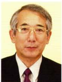
Toshikazu YOSHIKAWA 吉川敏一

Deputy Director General, National Institute of Informatics 国立情報学研究所・副所長