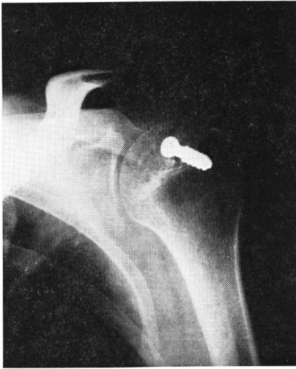
写真2-a 手術後のX線像，螺子にて骨片を固定した。