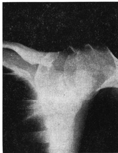
写真1-b 上腕骨外転位で骨折面が剥れ骨片が上方に転位している.

Miyako ISHIGAMI, Osamu NAMIKI, Miyoko HAYASHI Department of Orthopedics (Chairman: Naoki MORISAKI) Tokyo Women's Medical College: Isolated avulsion fracture of the lesser tuberosity of the humerus