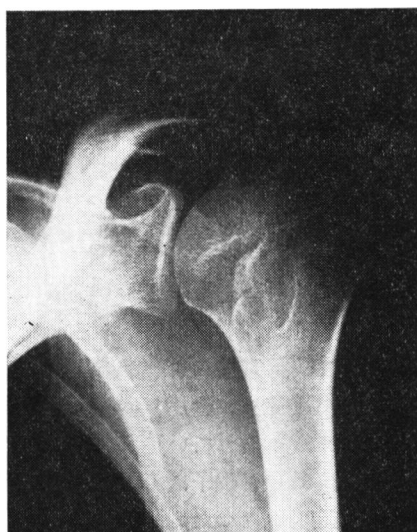
写真1-a 来院時のX線像. 上腕骨小結節の骨折で骨片が認められる.

来院時所見: 左肩関節部前面の著しい腫脹, 皮下出血, 疼痛があり, 左上肢は内外転中間内旋位