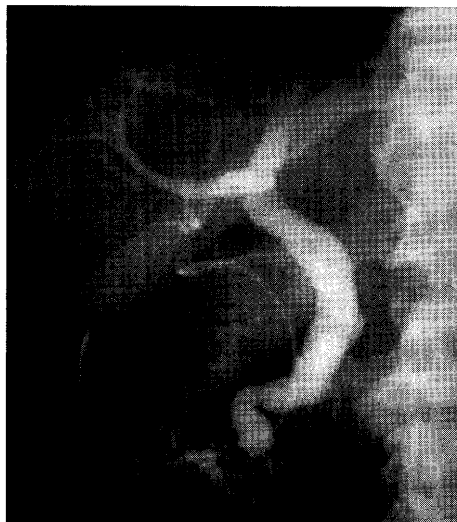
図4 胆管造影検査所見