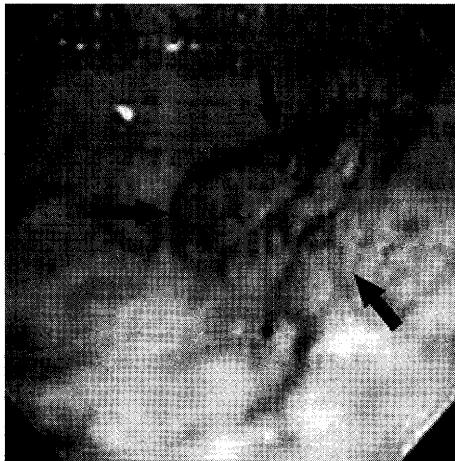
図1 上部消化管内視鏡所見 胃体下部後壁大弯よりに35×20mm大のIIa病変を認める。